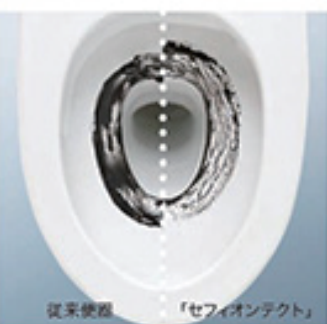
従来便器 「セフィオンテクト」