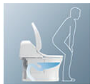
オート便器洗浄 ● P.22