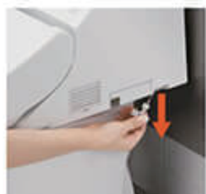
停電時安心設計 ● P.22