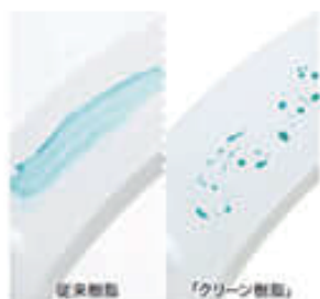
クリーン樹脂 ● P.9