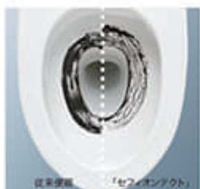
セフィオンテクト ● P.9