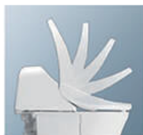
オート開閉 ● P.22 (GG3-GG3-800のみ)