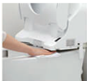
お掃除リフト ● P.166