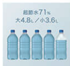
超節水 ● P.19 超節水71% 大4.8L/小3.6L