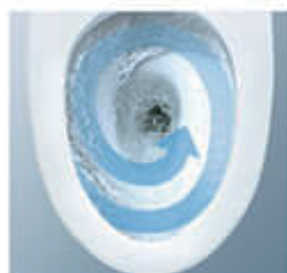
トルネード洗浄 ● P.17